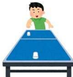
テーブルスケートボール