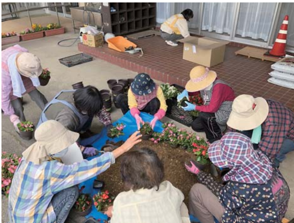
▲花を植え替えるひだまりの会の皆さん

5月15日、ひだまりの会広瀬支部の皆さんが、鉢に花苗を移植して、高齢者宅へお花を届ける活動を実施されました。