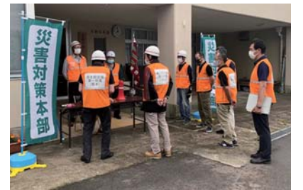
▲本部に安否集計を報告する各自治会長