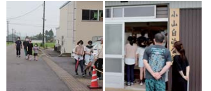
▲一次避難場所へ避難する