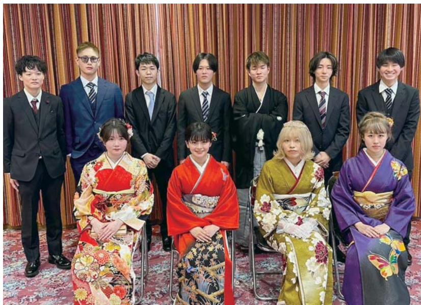
写真は広瀬地区の参加者の皆さん

1月8日福光中央会館5階で二十歳の集いが開催されました。福光校区62名吉江校区62名の合計124名の参加者でした。(R4民法改正により18歳で成人)二十歳の節目を迎えられおめでとうございます。皆様の今後益々のご活躍を祈念します。