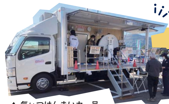
▲ 気いつけんまいカー号